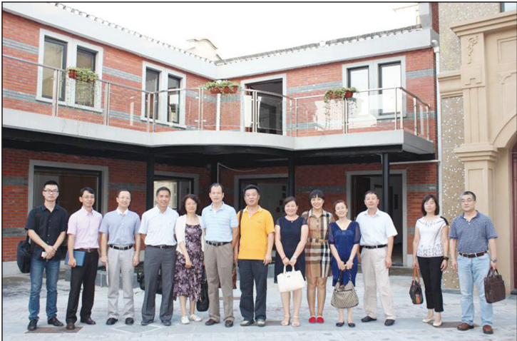
【图片新闻】(通讯员 齐佳龙)日前,在浦东中医药协会的组织下,来自中医药及健康产业研发、生产、营销领域的专家,政府主管部门及行业协会领导,三甲医院的科研负责人20余人齐聚上海前滩尚博创意产业园为中医药产业献计献策,共谋发展。

20世纪60年代,以颜德馨为首的中西医结合科研小组开展了白中西医结合流派云集之所,在祖国医学发展史上产生过重大影响